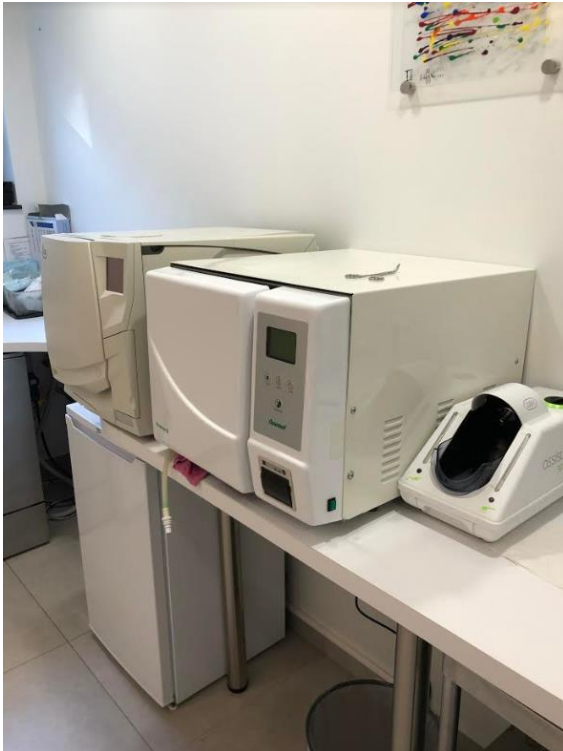
Autoclave classe B

stérilisation totale des instruments emballés. Ils restent donc complètement stériles dans leurs emballages jusqu'au moment du soin.